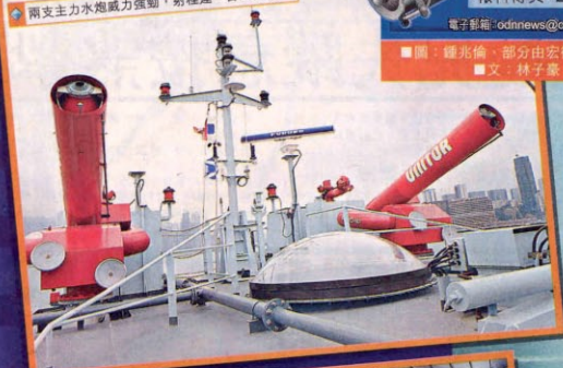
兩支主力水炮威力強勁，射程達一百五十米。