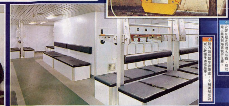
船內設有緊急會議室，令精英號成為滅火輪多項新船隻。