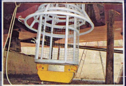
安裝在船底的潛水吊籠，有助蛙人盡快到海底執行任務。