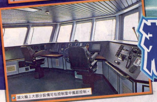
滅火輪上大部分設備可在控制室遙距控制。