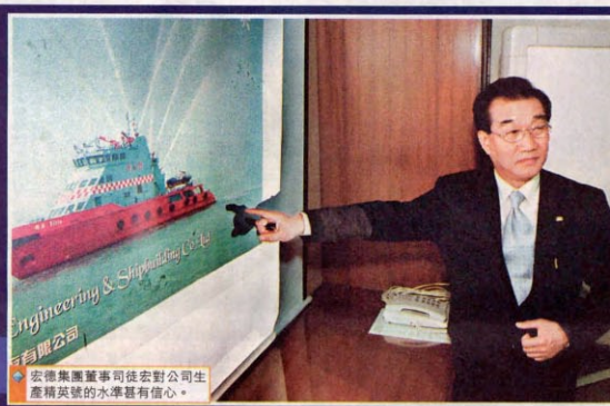
安德集團董事司徒宏對公司生產精英號的水準有信心。