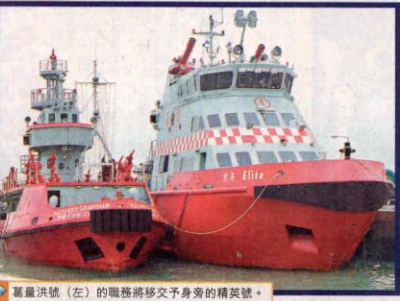
葛量洪號（左）的職務將移交予身旁的精英號。

葛量洪號在一九五三年，由本港著名的黃埔船塢建造，在過往四十九年的服役期間，多次執行大型海上火災撲救任務。戰後船塢，消防處計畫將它改裝成一艘具有特色的消防博物館，擬擇址於馬灣。目前正與馬灣的發展商進行磋商，未來消防博物館內將展出香港消防處歷史、消防人員制服變化及珍貴陳列品。為免葛量洪號船底被海水侵蝕，船身會升上陸上的平台，葛量洪號四周平台會注入小量海水以突顯其滅火輪的特色。