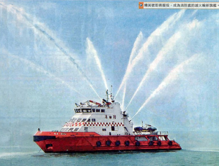
精英號即將服役，成為消防處的滅火輪新旗艦。